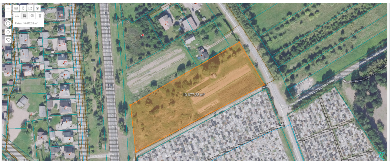
Planuojamos teritorijos plotas apie 1,10 ha