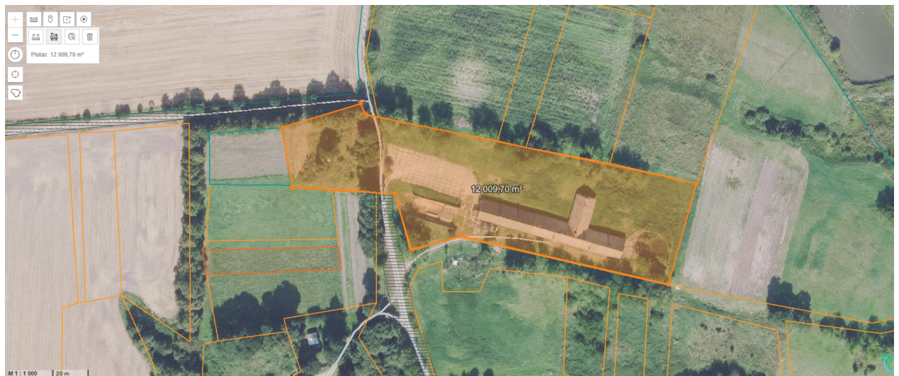
Planuojamos teritorijos plotas apie 1,20 ha.