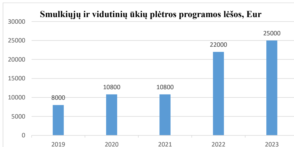
1 diagrama. Lėšų pokytis 2019–2023 m.

Iš 2023 m. biudžeto Kelmės rajono savivaldybės taryba šiai programai įgyvendinti skyrė 25 000 Eur. Visos Smulkiųjų ir vidutinių ūkių plėtros programai skirtos lėšos buvo panaudotos.